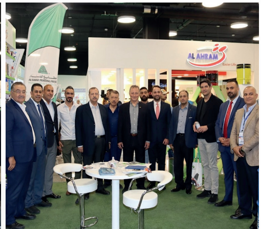
افتتاح معرض الترابطات الأردني الرابع للتعبئة والتغليف جوبكس 2024