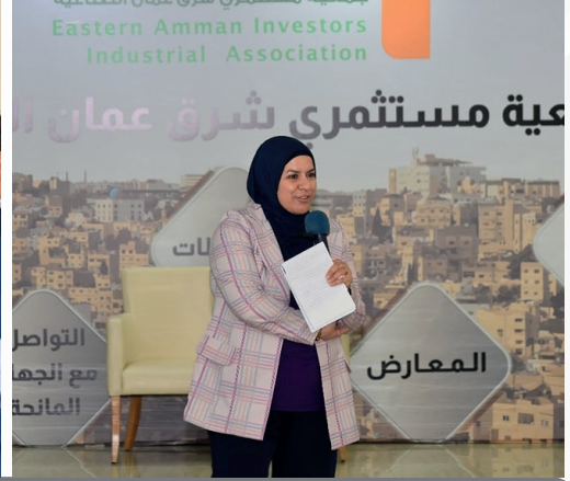
إطلاق مبادرة لتعزيز قطاع التعبئة والتغليف في جمعية مستثمري شرق عمان بالتعاون مع USAID