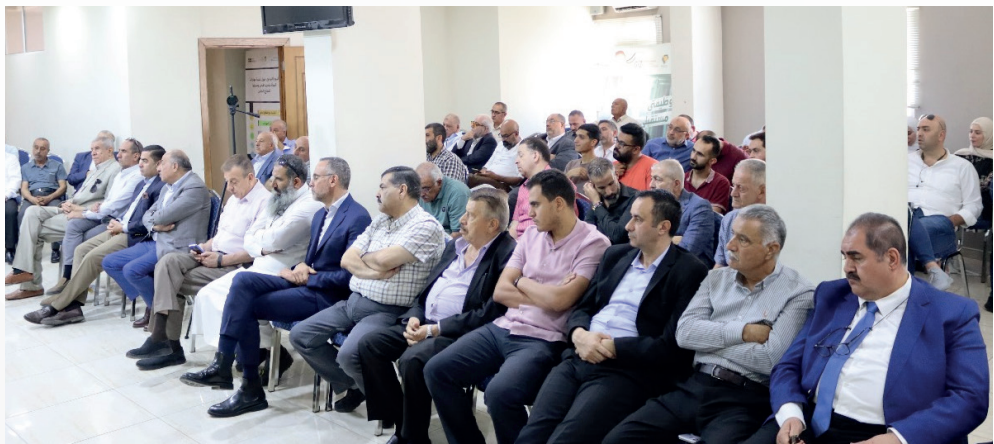
جلسة حوارية بعنوان دور الأحزاب في تطوير الحياة السياسية في الأردن