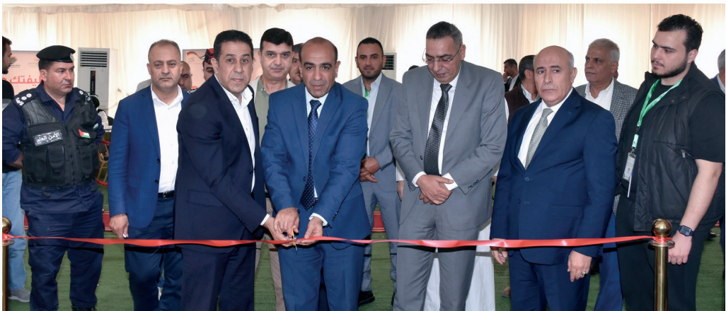
المعرض الوظيفي التاسع بمشاركة 50 شركة صناعية وتوفير مايزيد عن 800 فرصة