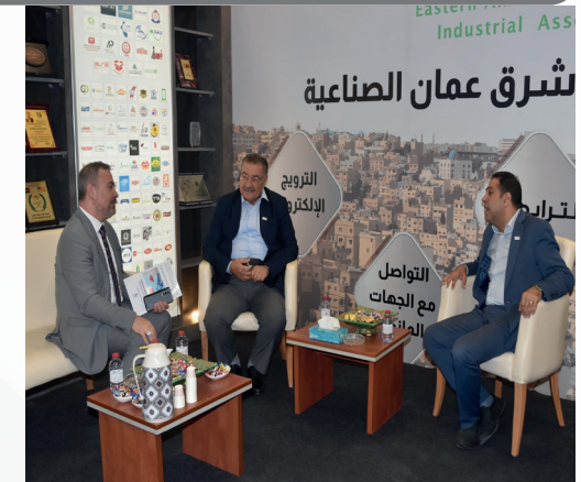
مشاركة جمعية مستثمري شرق عمان الصناعية في المعرض العربي الدولي للصناعات البلاستيكية والبتروكيمياوية والتعبئة والتغليف، تعزيزاً لدور القطاع الصناعي.