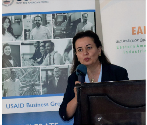
الجلسة التعريفية لمشروع نمو الاعمال USAID