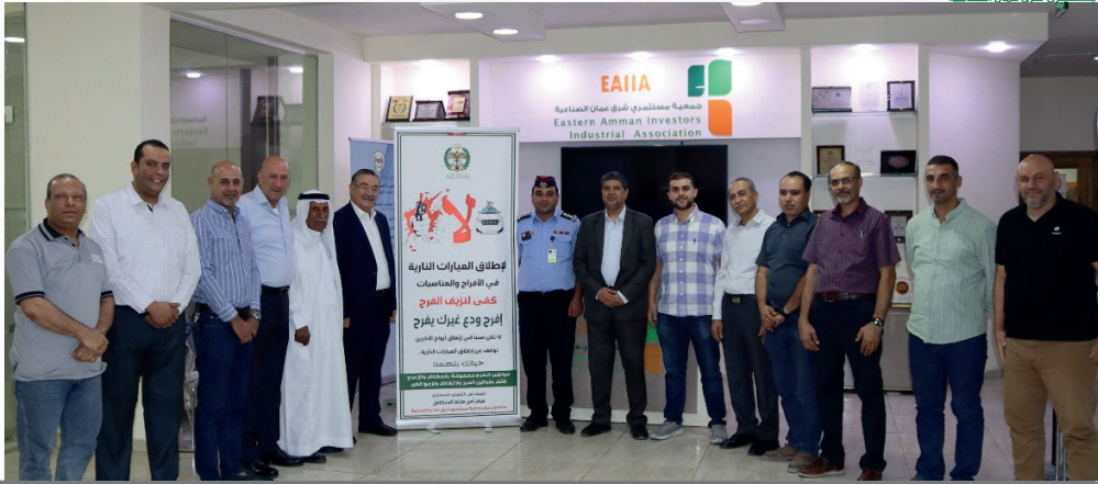
مبادرة لإطلاق العيارات النارية بالتعاون مع مجلس أمن ماركا، للتوعية بمخاطر هذه الظاهرة خلال المناسبات.