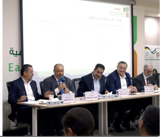
اجتماع الهيئة العامة العادي الثالث عشر لعام 2024