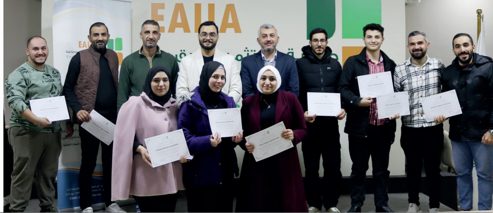
الدورة التدريبية التسويق الإلكتروني للشركات الصناعية