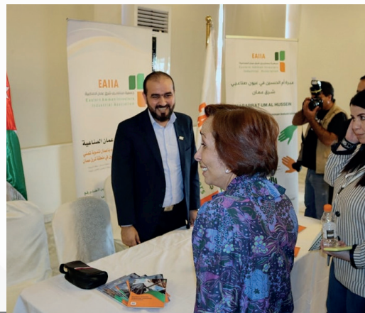
مشاركة جمعية مستثمري شرق عمان الصناعية في البازار الدبلوماسي الستين تحت رعاية سمو الأميرة بسمة، دعماً لأطفال مبرة أم الحسين