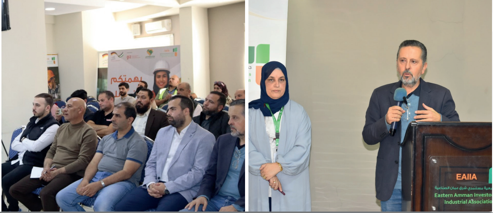
جلسة توعوية حول أنظمة السلامة والصحة المهنية والتشغيل