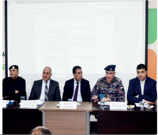
اللقاء النقاشي حول تحديات الصناعيين بحضور ممثلين عن الجهات الحكومية