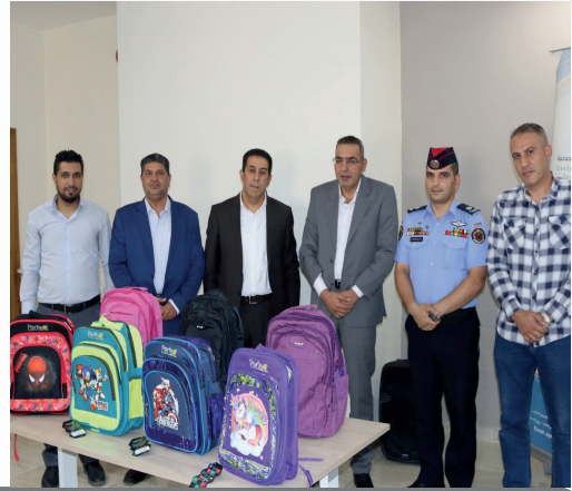
مبادرة حقيبة الطالب حيث تم توزيع 600 حقيبة مدرسية بالتعاون مع مجلس محلي أمن ماركا