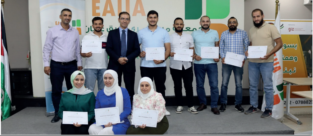
الدورة التدريبية إدارة المشتريات وسلاسل التوريد للشركات الصناعية