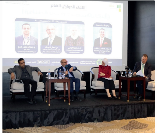
الجلسة الحوارية « الذكاء الاصطناعي في الصناعة » التي عقدت على هامش معرض جوبكس 2024