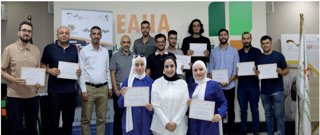
البرنامج التدريبي مهارات الإشراف