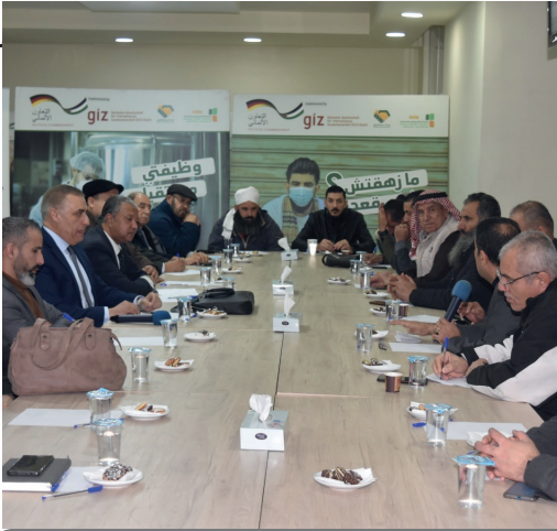
الجلسة النقاشية حول تقليل انبعاثات الكربون والمبادرات الخضراء