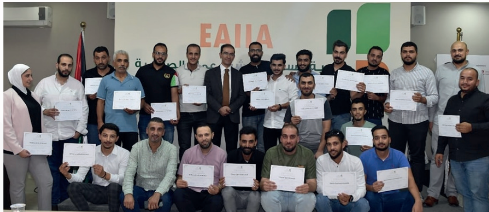
الدورة التدريبية إدارة المستودعات والسيطرة على المخزون للشركات الصناعية