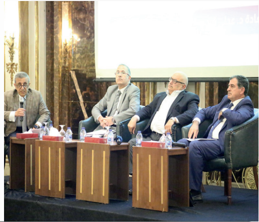
الجلسة الحوارية ممارسات اقتصادية فعالة لديمومة القطاع الصناعي وتعزيز فرص التشغيل خلال الأزمات