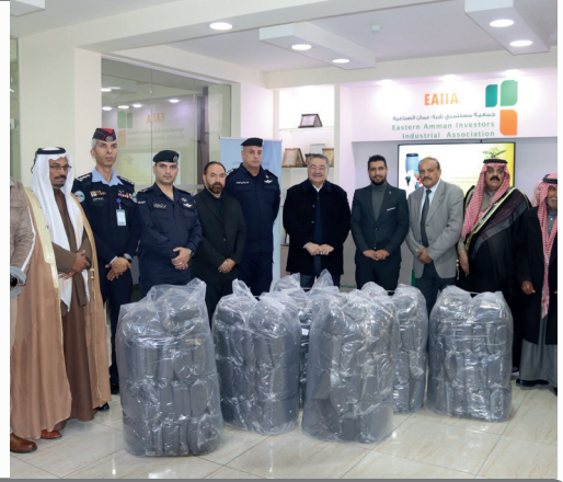
مبادرة عطاء لدفع الشتاء لتوزيع الجاكيتات على طلاب المدارس المحتاجين والأيتم في ماركا