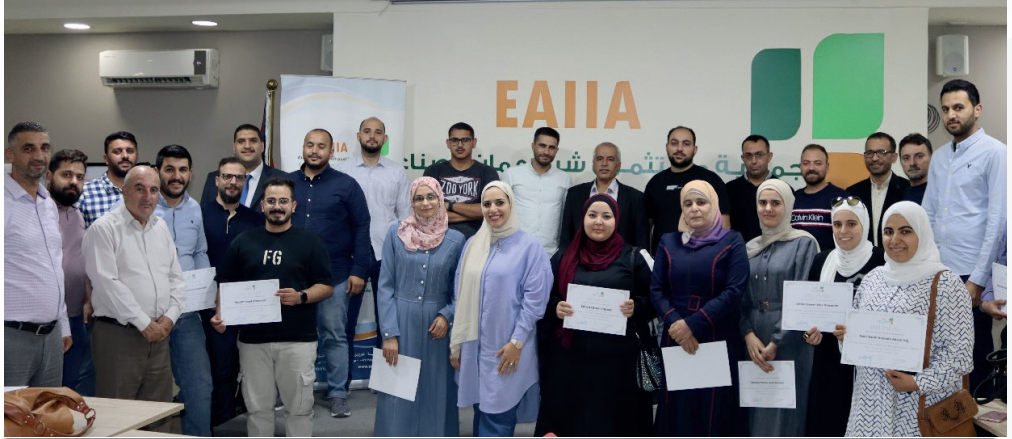
الدورة التدريبية حول ضريبة الدخل والمبيعات ونظام الفوترة الوطني