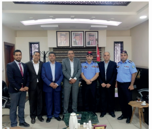
تكريم جمعية مستثمري شرق عمان الصناعية لدورها الريادي في المسؤولية المجتمعية تجاه المدارس في لواء ماركا