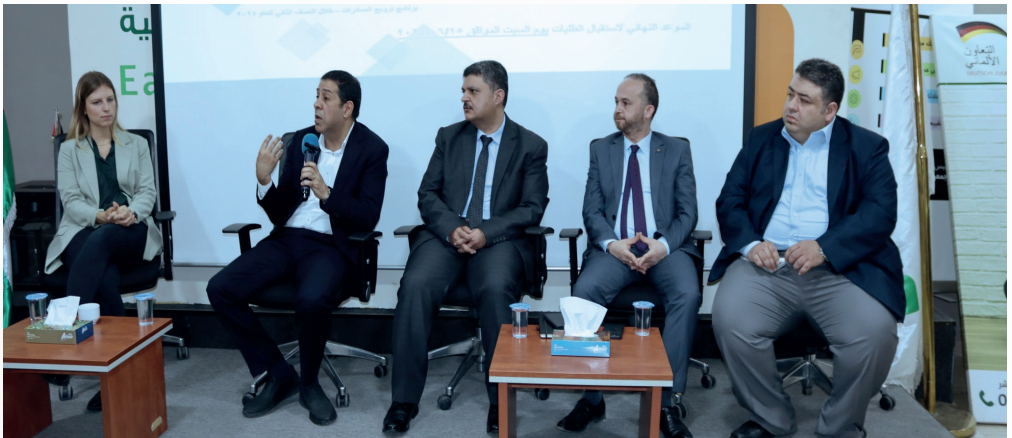
الجلسة التعريفية لبرامج صندوق دعم الصناعة ( الجولة الأخيرة )