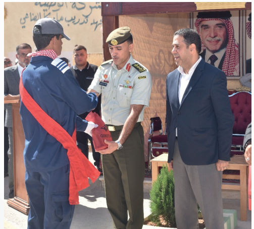
تخريج الدفعة 30 من خريجي معهد جمعية مستثمري شرق عمان الصناعية المهني والشركة الوطنية للتعبئة والتغليف والتدريب